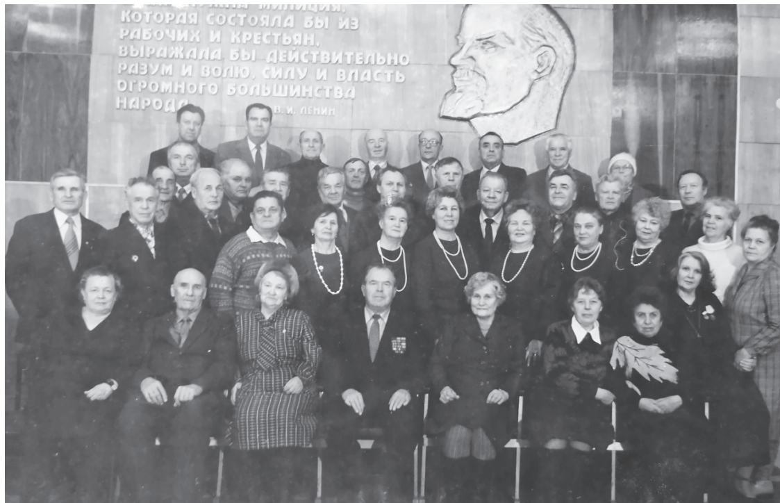
• Первая учредительная конференция ветеранов ОВД Новгородской области. Новгород, 11 декабря 1991 года