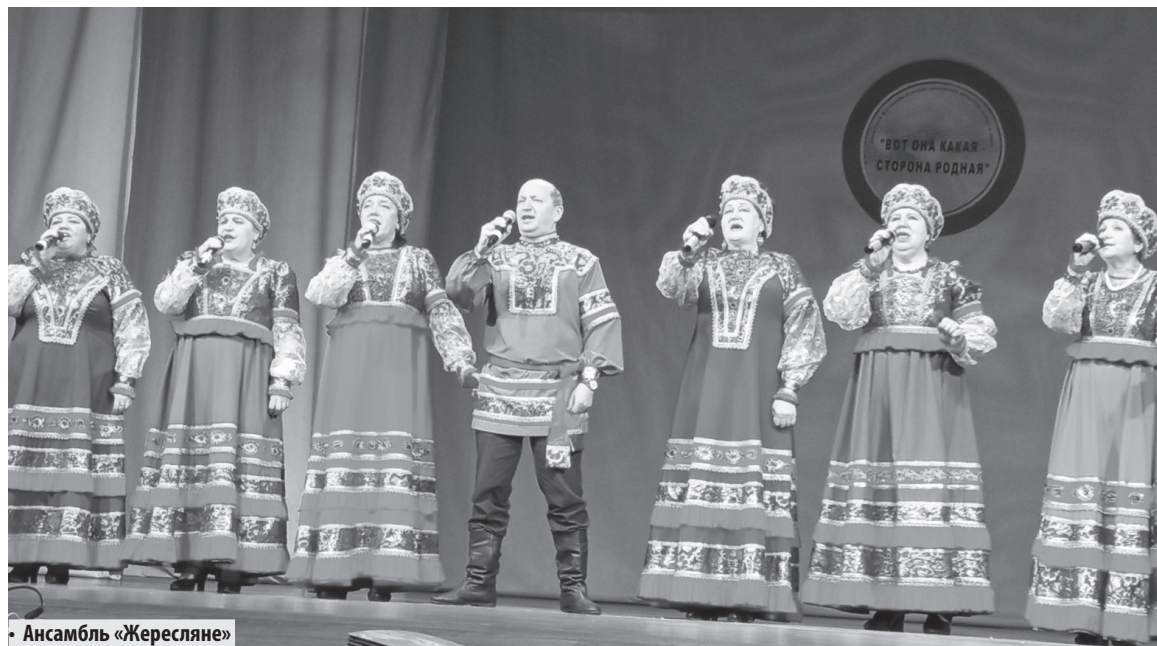
• Ансамбль «Жересляне»