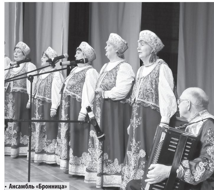
• Ансамбль «Бронница»