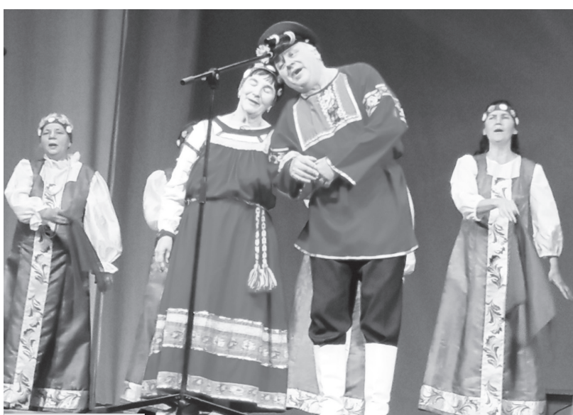
• Хор «Белореченька»