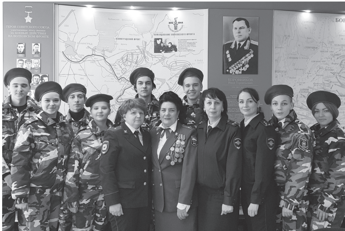
• В Музее истории ОВД Новгородской области

Ветераны УМВД России по городу Великий Новгород принимают участие в профессиональной подготовке молодых сотрудников и воспитании личного состава на боевых и трудовых традициях с целью создания позитивного отношения к деятельности новгородской полиции. Молодым сотрудникам читаются лекции на такие темы, как: «Культура общения как один из основных критериев повышения доверия населения к сотрудникам полиции», «Ветераны ОВД – носители профессиональных традиций», «Навечно в строю. Примеры героизма сотрудников ОВД». Лекции, занятия, встречи и беседы с учащимися и студентами образовательных учреждений Великого Новгорода и области, направленные на популяризацию службы в органах внутренних дел, обычно приурочены к памятным датам, таким как вывод войск из Афганистана, освобождение Новгорода от фашистских захватчиков.